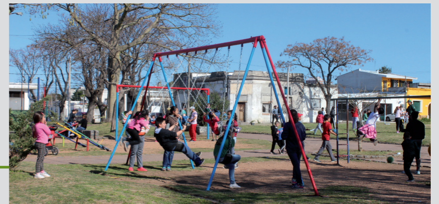
Actividad recreativa para niñas/os en Plaza Laguna