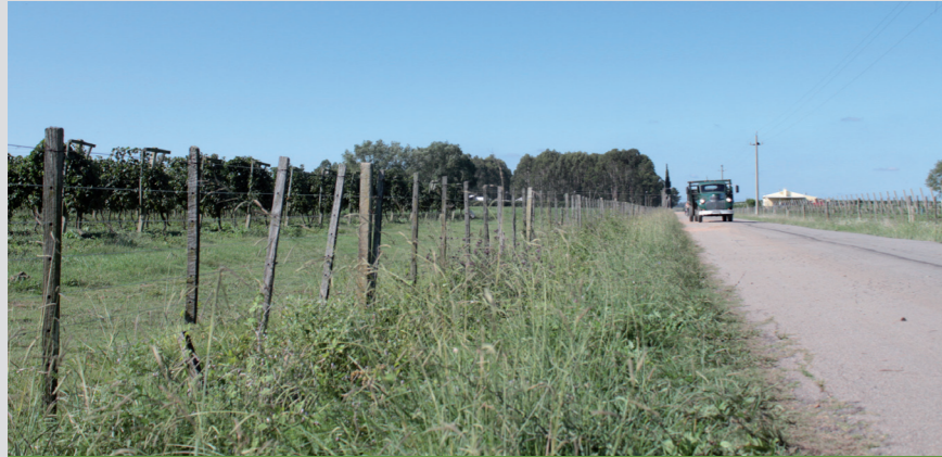
Camino América, zona rural