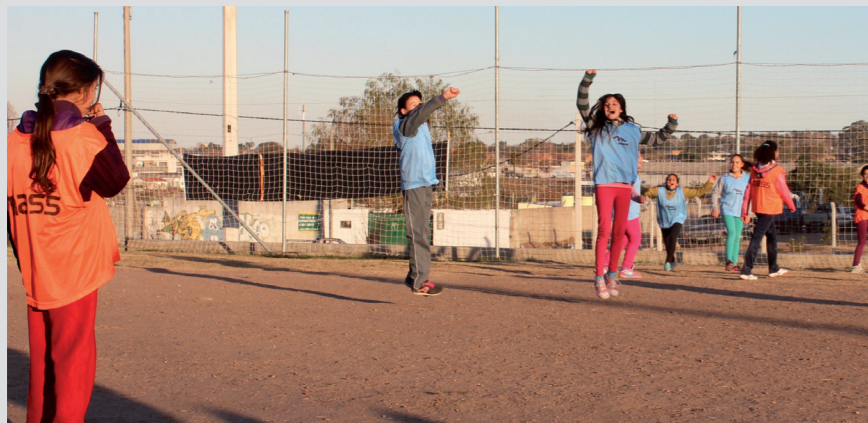
Escuela de fútbol femenino en Plaza Casavalle _un lugar para todos_