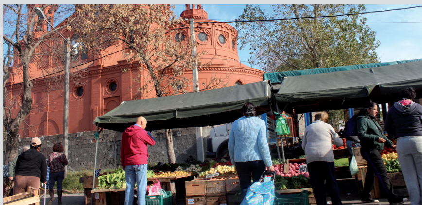
Feria vecinal sobre la calle García de Zúñiga