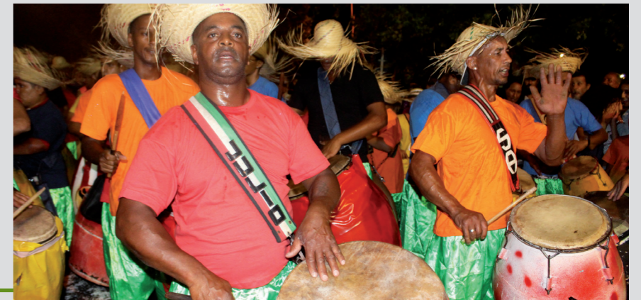
Curso barrial sobre Av. Belloni