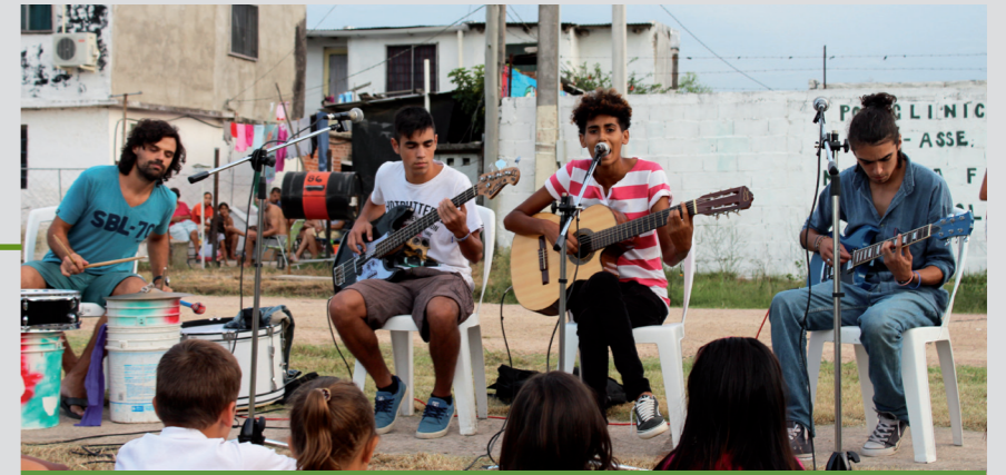
Feria cultural en barrio Fénix