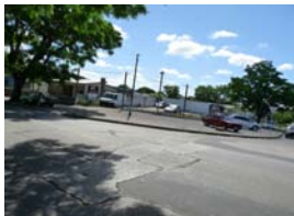
Semáforos en Burgues y Santa Ana

Estado de situación: Proyecto en elaboración