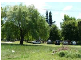
Plaza comunitaria en 20 de Febrero y Serrato