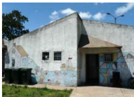
CAIF Mi Casita y Centro de Educación Comunitaria "El Cilindro"