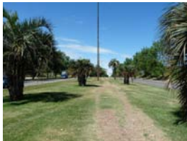
Circuito Aeróbico en avenida José P. Varela