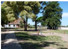
Entrada al conocimiento: Escuela "Junquillos"

Descripción: Obras de acondicionamiento y equipamiento del espacio