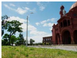
Plaza Mirador del Cerrito de la Victoria

Descripción: Obras de acondicionamiento en espacio frente a la Iglesia