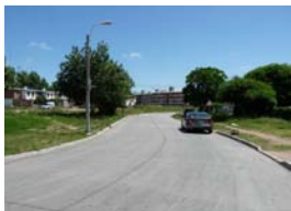
Circuito deportivo en Villa Española

Descripción: Construcción de veredas; acondicionamiento y equipamiento del espacio