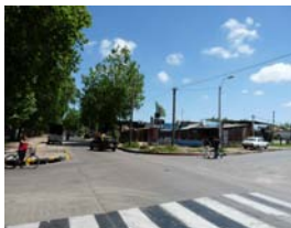
Semáforos en Belloni y Lacosta