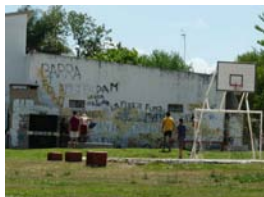
Juegos saludables y alumbrado del espacio Transatlántico