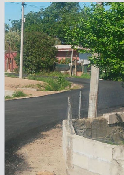
Mejoras de vialidad en calles barriales