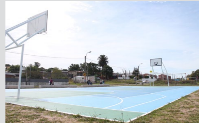
Nuevos espacios públicos barriales