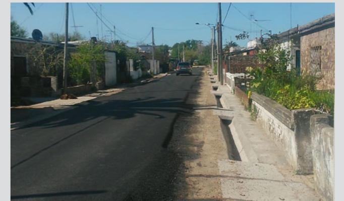
Mejoras en la vialidad interna