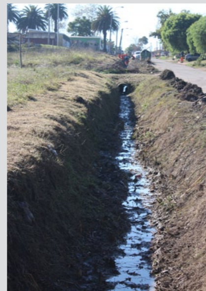
Acondicionamiento de cunetas