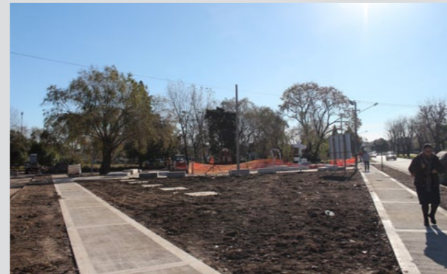
Apoyo en la concreción de proyectos de Presupuesto Participativo