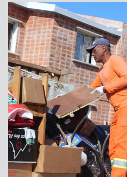
Apoyo en la relocación de asentamientos