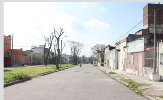
Tareas de poda masiva en barrios del Municipio d