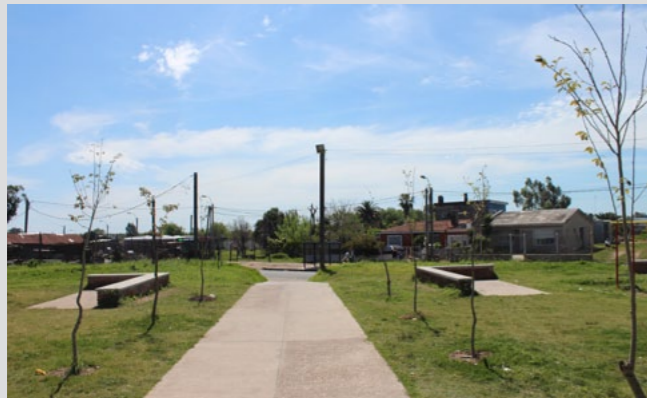
Plantaciones de árboles en espacios públicos