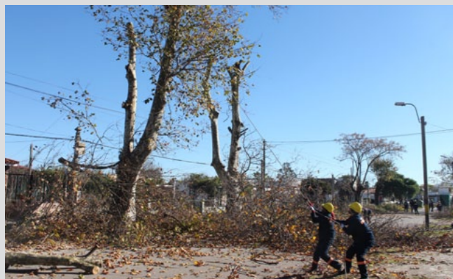
Tareas de poda y extracciones de raíces