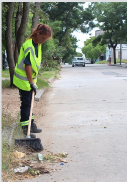
Tareas de barrido en calles barriales