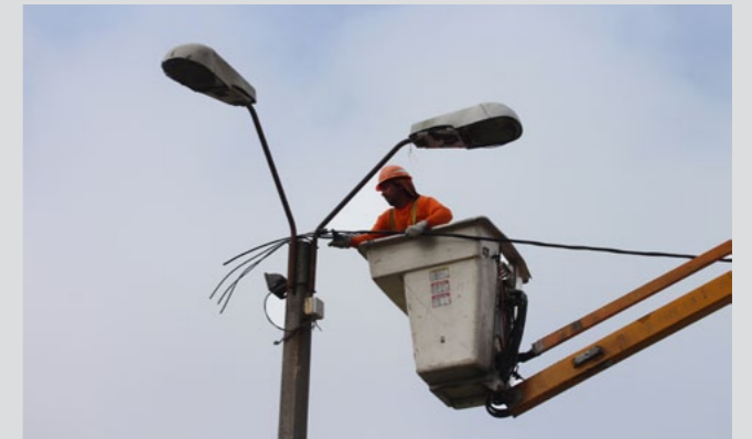
Mantenimiento del alumbrado público