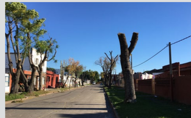
Mantenimiento del arbolado público