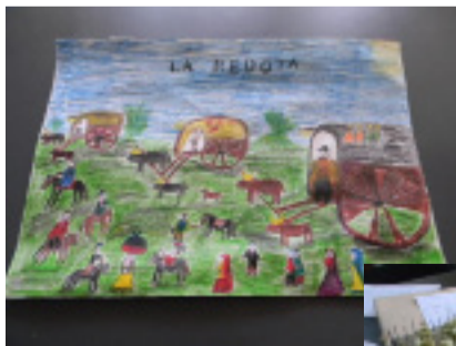
*Primer premio de la Categoría 2. Realizado por niñas/os de la Escuela N°268.

En la categoría de primero a tercero de liceo y UTU, en la que se pedía una representación tridimensional o maqueta, el Primer Premio lo obtuvo el Liceo N° 39, mientras que el resto de los premios fueron declarados desierto.