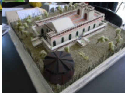
*Primer premio de la Categoría 3. Elaborado por adolescentes del Liceo N°39