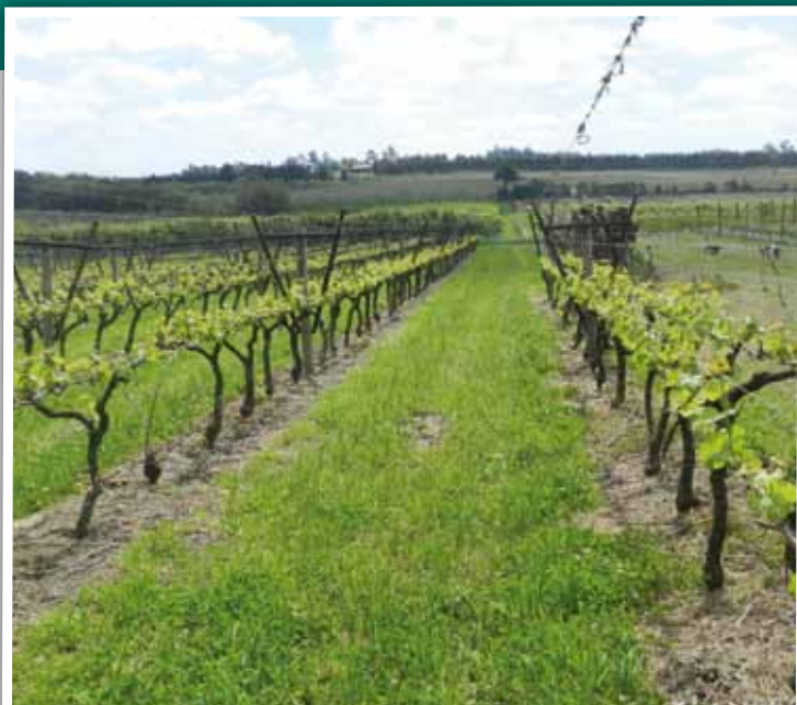
Viñedo Bodega Spinoglio